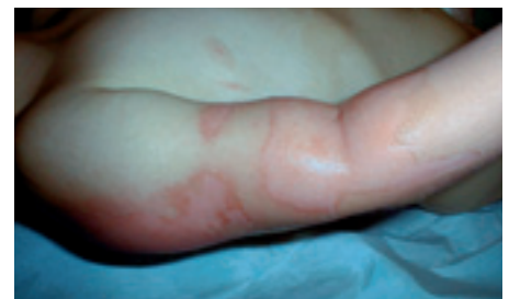
Figur 3 Annegradsskade/delhudsskade hvor blemmene er fjernet. Skoldings-skade i albuerogionen på tre år gammel pike.