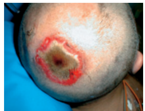
Figur 4 Tredjegrads-skade/fullhudsskade. Bakhodet på voksen mann med høyvoltskade.