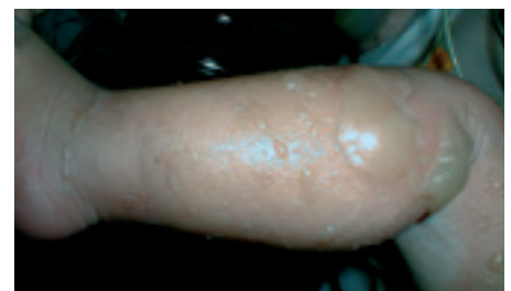
Figur 2 Annegradsskade/delhudsskade med blemmer. Venstre legg på ett år gammel gutt med skoldings-skade.