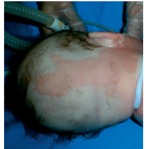
Figur 1 Førstegradsskade/epidermal skade. Bakhodet til fire måneder gammelt spedbarn med skoldings-skade.

Når sårene er reepitelialisert, vil huden trenge smøring med en fet fuktighetskrem morgen og kveld 6–12 måneder etter skadetidspunktet (2, 4). Brannskadeavsnittet, Haukeland Universitetssjukehus er alltid åpne for at man tar kontakt vedrørende råd om behandling, telefon 55 97 35 60 (seksjons-overlege H.A. Vindenes, Brannskadeavsnittet, personlig meddelelse). Har man muligheter for digital fotografering, kan bilder av