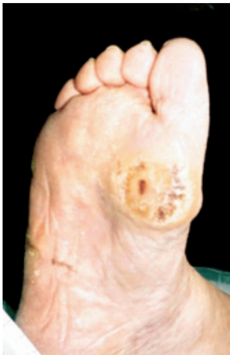
Figur 1 Diabetiske fotsår som følge av en sensomotorisk nevropati over hodet av grunnleddet på høyre stortå. Typisk for nevropatiske sår er ren sårbunn og hyperkeratoser i sårkanten